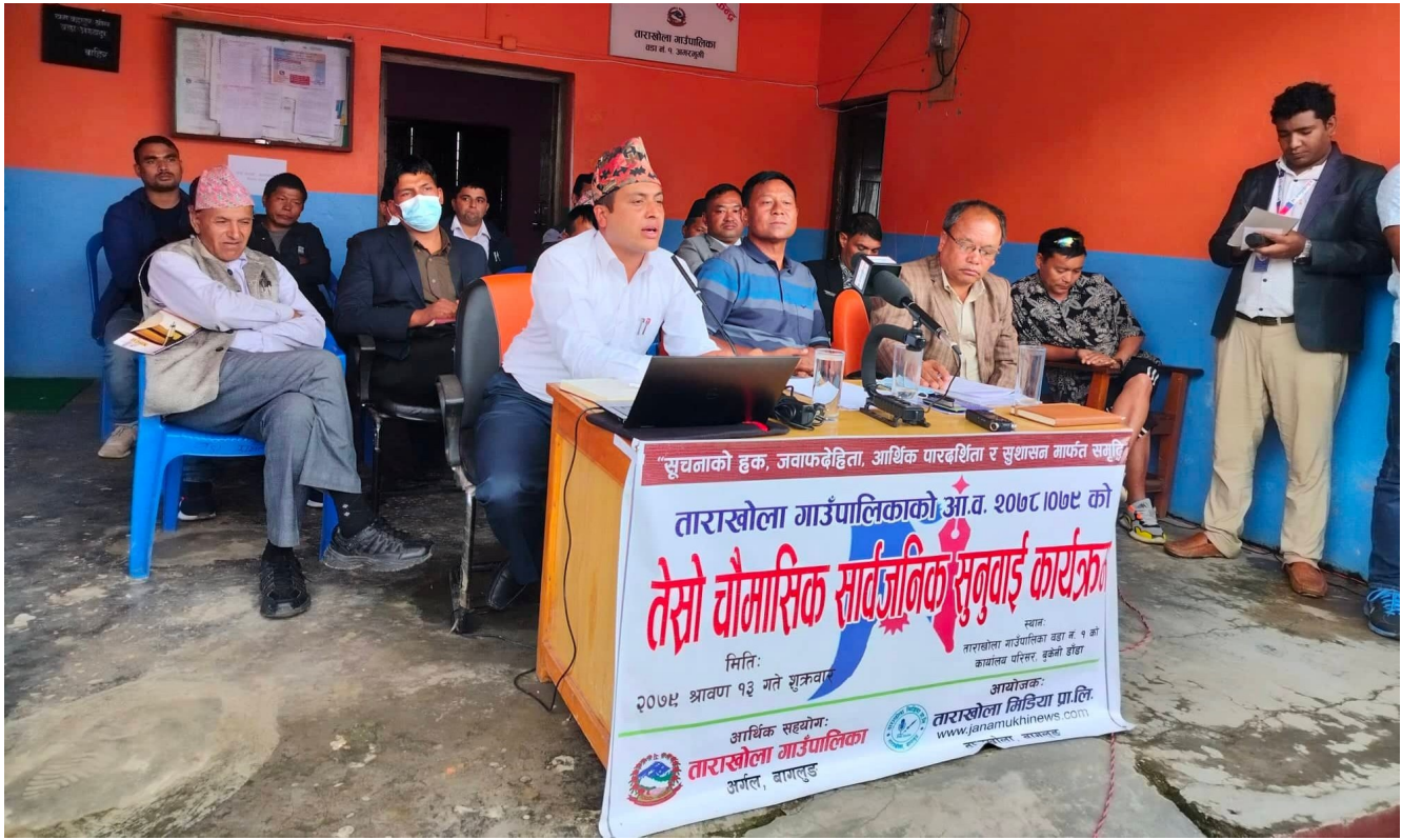
कार्यक्रममा जवाफदेयी निकायको तर्फबाट सहभागीहरु