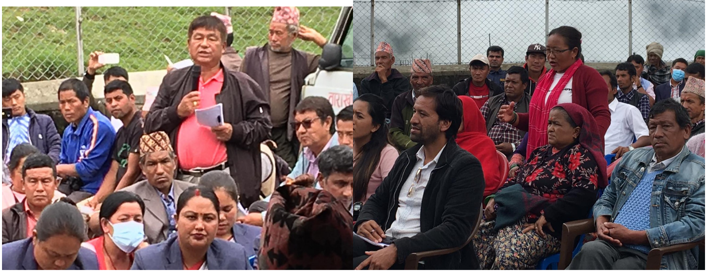
कार्यक्रममा सहभागी द्वारा जिज्ञासा राख्दै