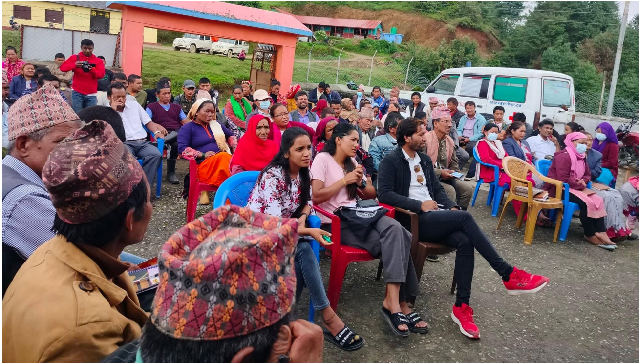
कार्यक्रममा उपस्थित सहभागीहरु