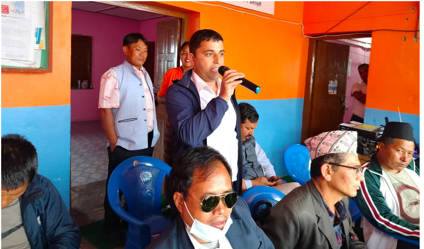
शिक्षा संग सम्बन्धित प्रश्नको जवाफ दिदै शिक्षा साखाका प्राविधिक सहायक .